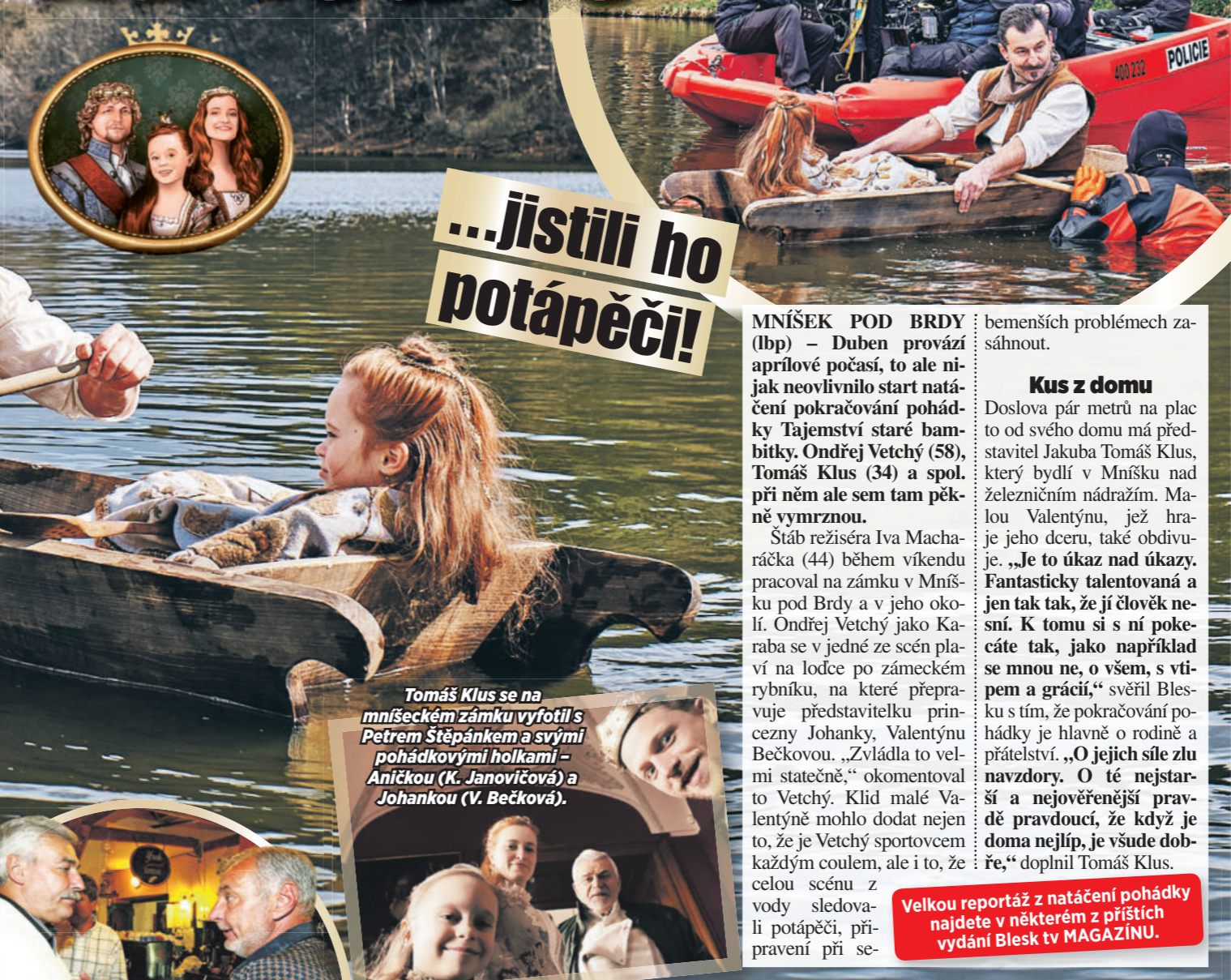
Natáčení přímo na Zámeckém rybníku jistili potápěči.