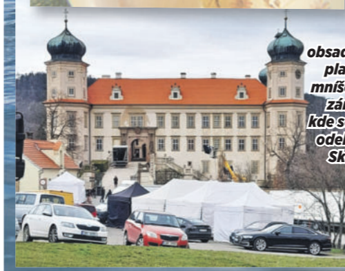
Štáb obsadil celý plac před mníšeckým zámkem, kde se jinak odehrávají Skalecké pouťi.