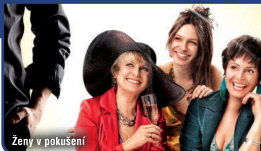
Ženy v pokušení