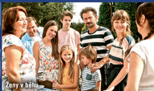
Ženy v běhu