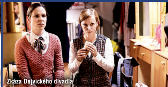
Zkáza Dejvického divadla

svou svatbu. Nechtěla jsem, aby tam pobíhala nějaká svatební koordinátorka a dirigovala lidi, kdy se mají jít vyfotit a jak se mají bavit. Tak jsem řekla kamarádům, ať mi nedávají žádné dary, protože nemám ráda věci, ale místo toho ať si vezmou částečně na starost organizační záležitosti. A tak se někdo postaral o výzdobu, někdo o ubytování, všechno běželo v pohodě, lidi korzovali, bavili se, žádný stres, každý si dělal, co chtěl. Přesně tak jsem si svatbu představovala a byla opravdu nejhezčím dnem mého života.