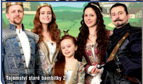
Tajemství staré bambitky 2

zahrála v pokračování, byla jsem šťastná, že se do toho týmu můžu infiltrovat. Můj příběh se protne s příběhem královského páru Jakuba a Aničky. V mém království se totiž usadí ti dva povedení a vyhnání rádcové a začnou mi škodit. Pohádka se měla natáčet už loni, ale produkce ji kvůli covidu stopla. Pak jsem začala v létě natáčet Hvězdy, hrála na Hradě Shakespeara. Protože byla dlouho zavřená divadla, měla jsem čas na jinou práci. Ale bylo to zvláštní, všichni jsme si udržovali odstup, nikam se po natáčení nechodilo posedět, nikdo si nepodával ruce, herci a štáb jedli zvlášť, pokud to bylo možné, pořád jsme se nechávali testovat. Já jsem se ani nefotila s lidmi, kteří mě o to požádali, myslím s fanoušky. Tím, že jsem pracovala na několika projektech, nechtěla jsem žádný ohrožit. Vnímala jsem u všech velkou pokoru, že vůbec můžeme pracovat. Ta u mě pořád přetrvává.